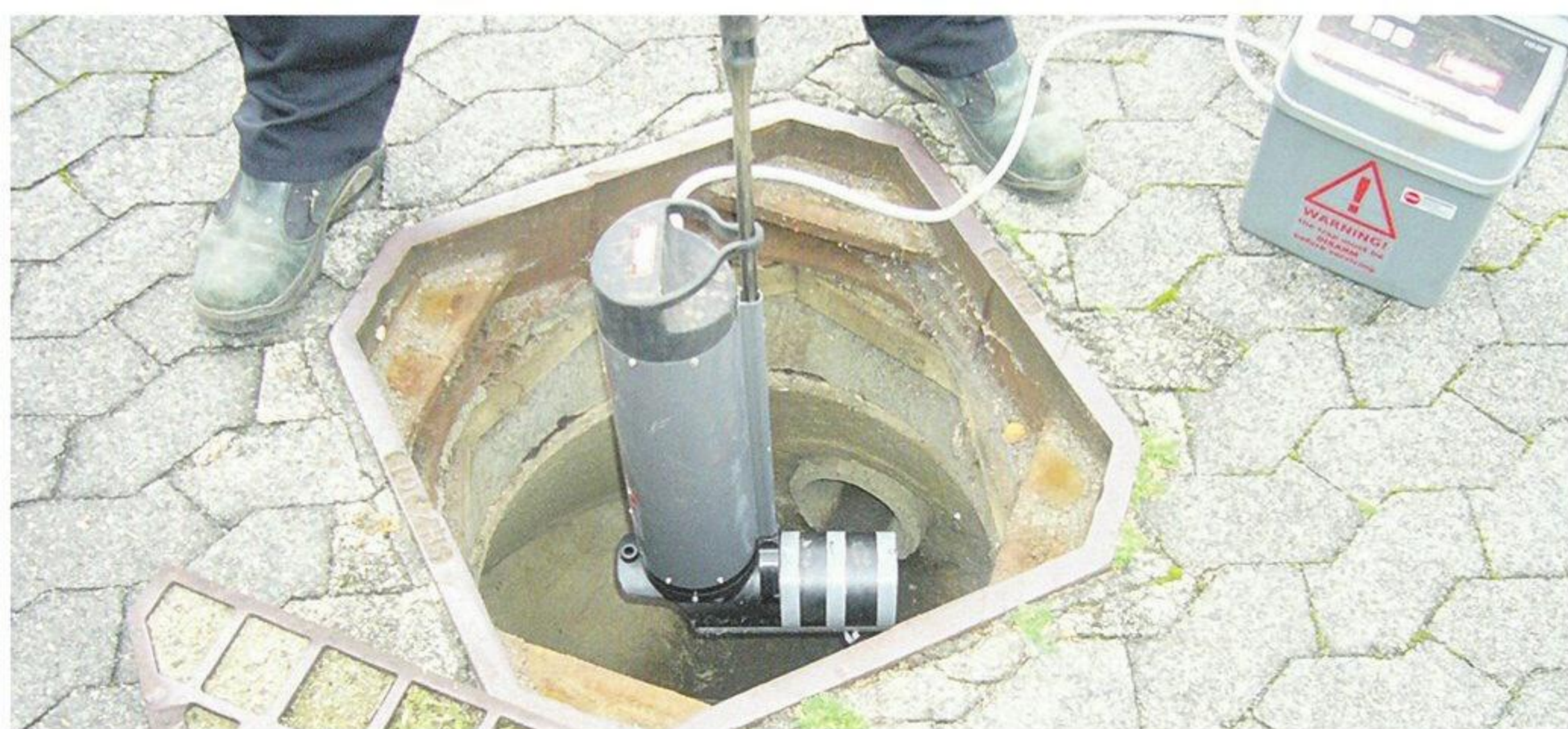
Fælden monteres let og hurtigt i kloakken.